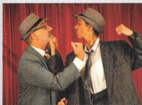
Warum streiten sich die beiden?